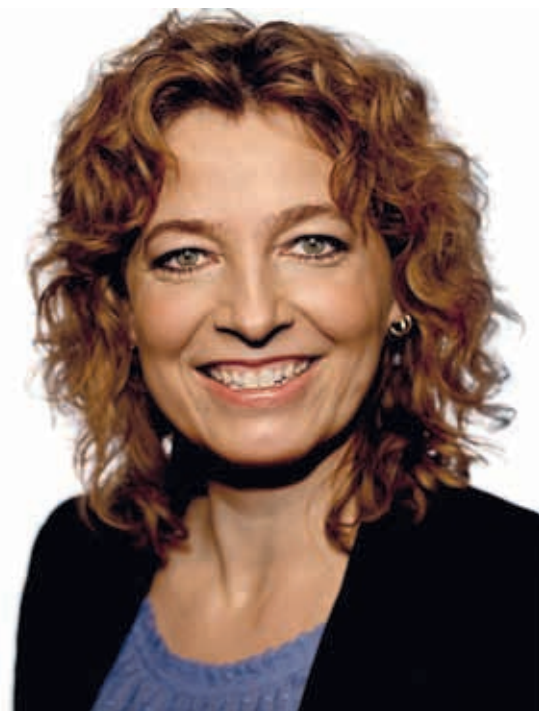
v. Christine Antorini, Børne- og undervisningsminister

Jeg ønsker alle deltagere ved DM for transportlærlinge held og lykke under konkurrencen og god vind fremover i jeres videre uddannelse og arbejdsliv!