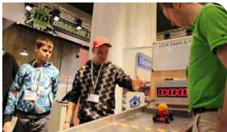
ITD stiller blandt andet med en bane, hvor du kan køre med minilastbiler på tid, når der er DM for transportlærlinge i Aabenraa den 24. maj.

ITD støtter i år DM for transportlærlinge ved at lave en række aktiviteter på dagen. Formålet er at lokke flere interesserede ud at se de dygtige chauffører dyste om DM-titlen.