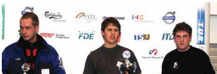
LAGER VINDERNE 2009

Langgodset i form af træ i bundter opsamles, manøvreres gennem en "port" og placeres på markeret område på et lad. Der skal lægges strøer. Dette gentages med ét nyt bundt træ. Rykkes porten skal gennemkørsel starte forfra. Trucken parkeres på markeret område.