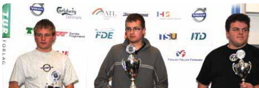
CHAUFFØR VINDERNE 2009

En 3 meter lang 4-kantet stolpe med øje/åg i toppen ligger på et markeret område. Den anhugges, transporteres til fundament og placeres i dette. Der bruges ikke kiler idet stolpen går i spænd i fundament. Stolpen bringes tilbage til udgangsposition. Der vil være slalomelementer undervejs. Kranen sættes i hvilestilling.