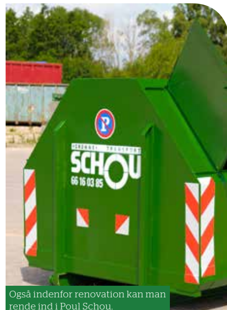
Også indenfor renovation kan man rende ind i Poul Schou.