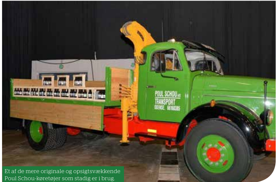
Et af de mere originale og opsigtsvækkende Poul Schou-køretøjer som stadig er i brug.

overskue mange forskellige situationer, for at kunne få det fulde ansvar for at trille et stort køretøj ud på landevejene.