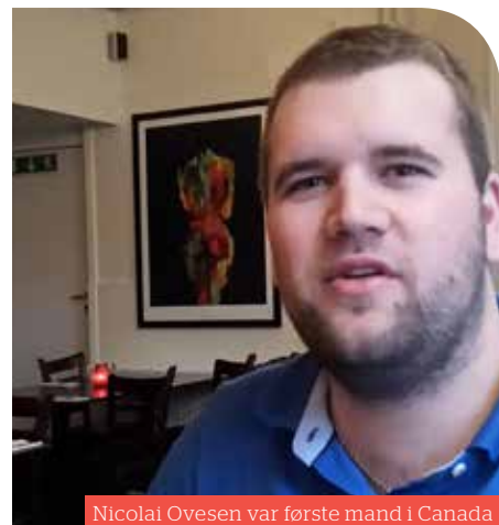
Nicolai Ovesen var første mand i Canada