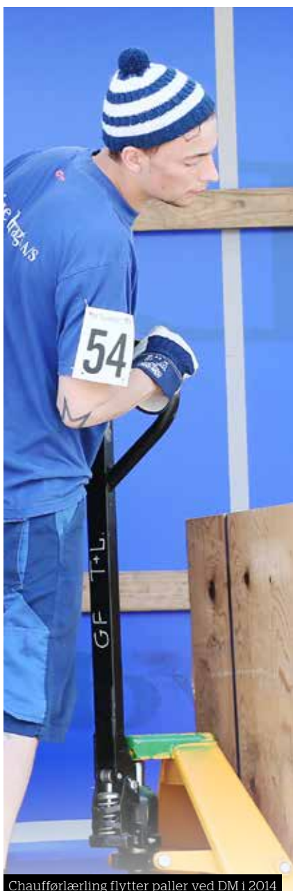
Chaufførlærling flytter paller ved DM i 2014

21. marts dyster landets dygtigste transportlærlinge om at blive danmarksmestre, men det er ikke kun personlig hæder, der er på spil i Herning. Hele transportbranchen høster fordele af mesterskabet.