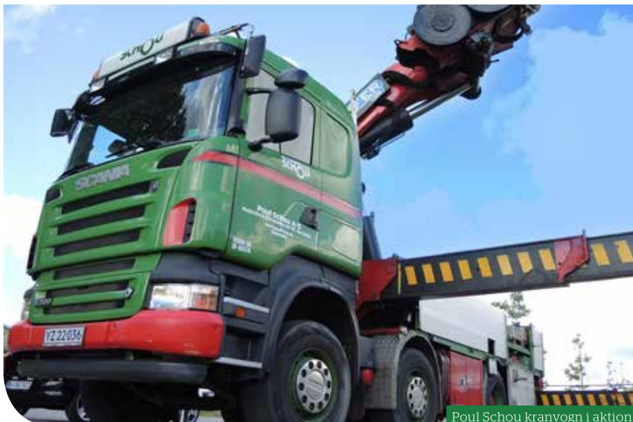
Poul Schou kranvogn i aktion